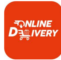
「ピックアップルーム」

■マルエツのネットスーパー（オンラインデリバリー） お店で取り扱う商品をスマートフォンやパソコンからご注文いただき、ご自宅や配送エリア内のご指定の場所で商品をお受け取りいただけるサービスです。注文いただいた商品は指定の配送時間帯でお届けいたします。