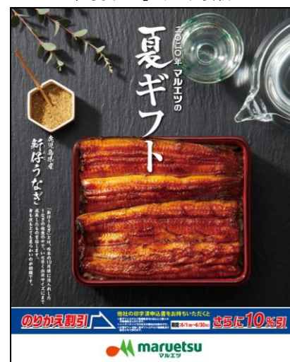
※2020年「夏ギフト」カatalog表紙