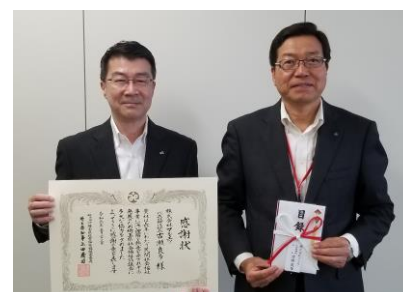
※埼玉県社会福祉協議会での目録贈呈式