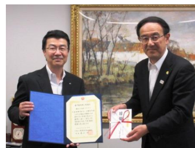
※東京都社会福祉協議会での目録贈呈式