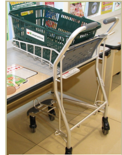
カートインできる 低いサッカー台